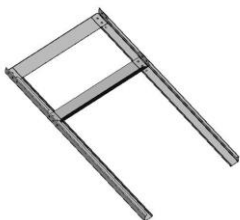
Схема сборки Ванны Моечной